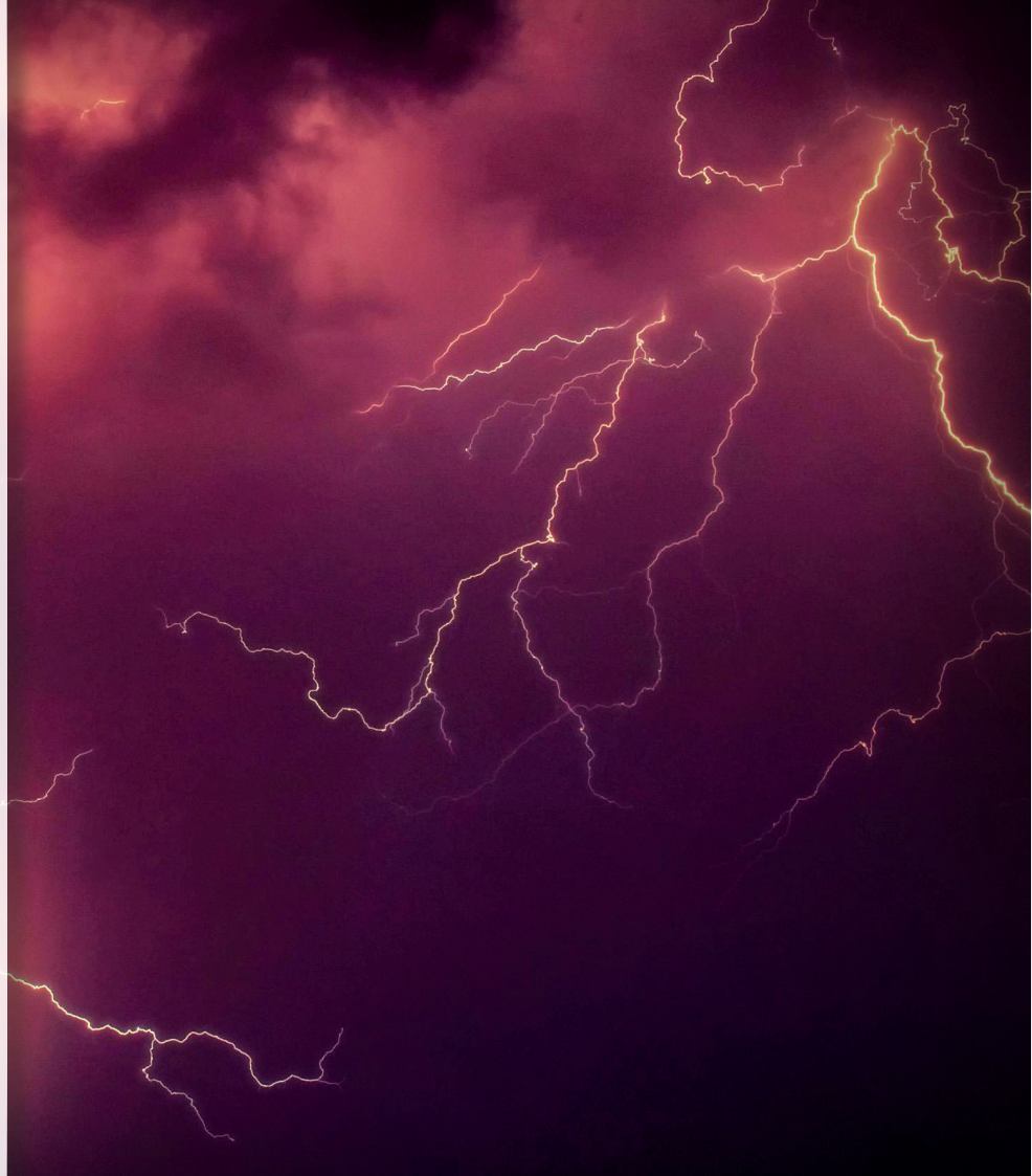
Illustration de couverture : Foudre pendant la nuit par Johannes Plenio

« Les jardins du Luberon » 331 rue Manon Lescaut 84120 Pertuis Tel: 06 82 77 62 65 Mail: ccpse06@gmail.com